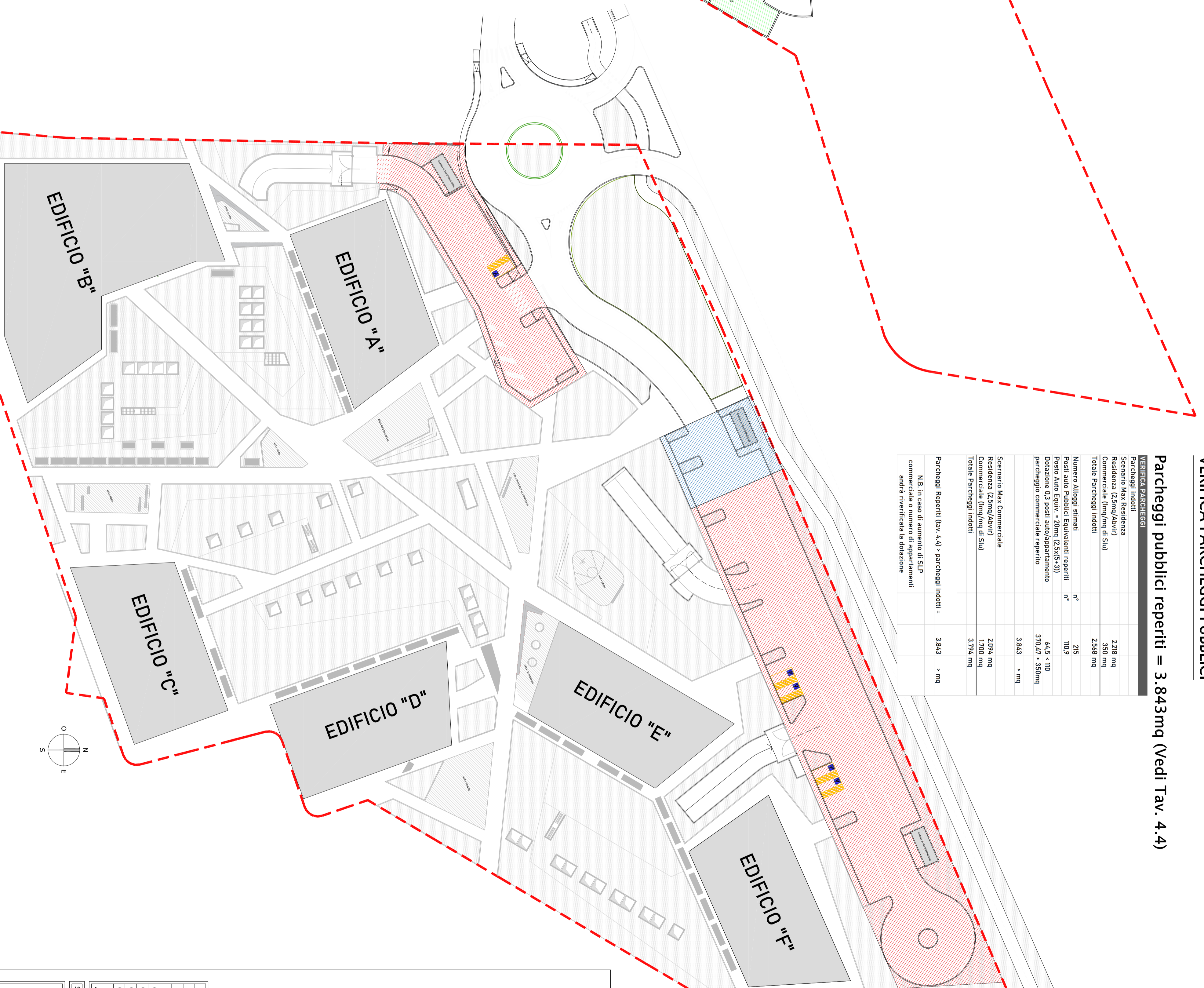
PLANIMETRIA GENERALE PIANO TERRA SCALA 1:500

dati da verificare in sede di rilascio di titoli applicativi